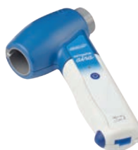
DATOSPIR aira FLEISCH