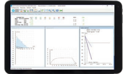
Apto para tablet con Windows 10