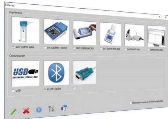
Compatible con todos los espirómetros Sibelman