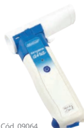
DATOSPIR aira DESECHABLE