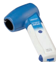
DATOSPIR aira TURBINA